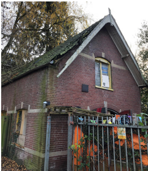
Foto uit 2020 van het geweermakershuisje.

Het pand heeft gemetselde gevels met rode machinale baksteen in staandverband met snijvoegen. Het metselwerk wordt ter hoogte van de vensterbank en van de aanzetstenen onderbroken door een speklaag. De gevelopeningen zijn voorzien van een segmentboog aan de bovenzijde en sluitsteen.